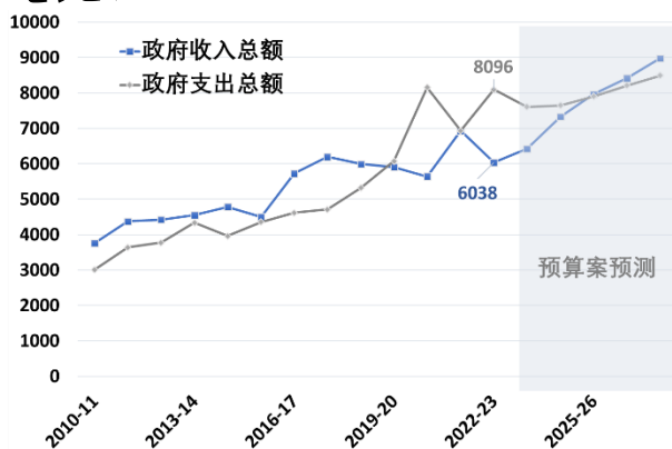
图 1: 特区政府收支及预测 (亿港元)

(六) 运输基建方面, 特区政府将按照《跨越 2030 年的铁路及主要干道策略性研究》的初步建议, 计划兴建三条策略铁路及三条主要干道, 并正就这些建议咨询公众, 以期于今年第四季构建香港未来的主要运输基建发展蓝图。